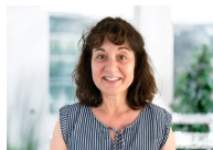
Editta Di Pietrantonio Sekretariat